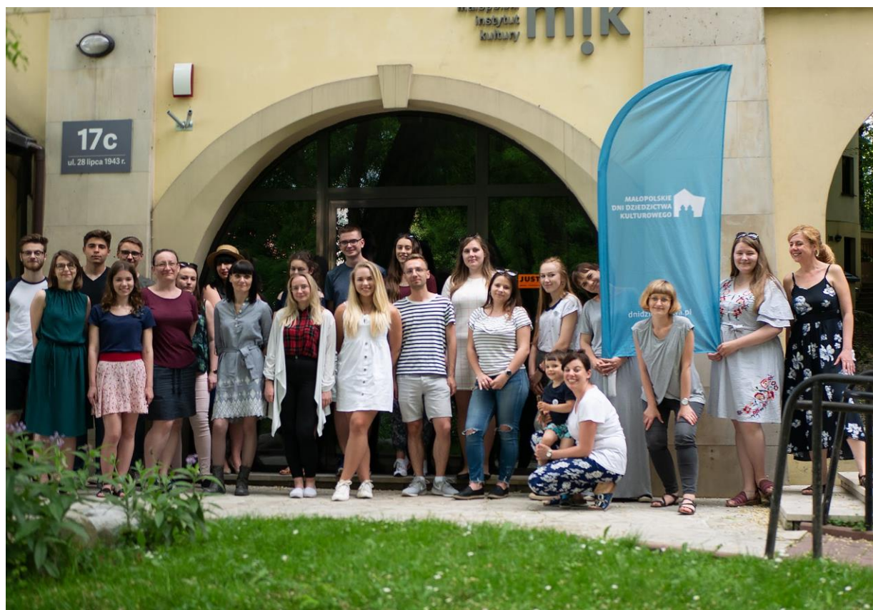
Wolontariusze i koordynatorki MDDK na spotkaniu ewaluacyjnym w czerwcu 2019

Włączenie grupy wolontariuszy do działań związanych z przygotowaniem Dni Dziedzictwa to również okazja do zweryfikowania sposobu organizacji całego przedsięwzięcia; wolontariusze pełnią funkcję zewnętrznych obserwatorów, więc ich zdystansowane spojrzenie pozwala uchwycić kwestie wymagające dopracowania. Z kolei dzięki pozytywnym opiniom wolontariuszy można na nowo docenić aspekty, które czasem pomija się w trakcie intensywnych przygotowań. Celem programu wolontariackiego jest stworzenie takich warunków i atmosfery współpracy, aby obie strony (korzystający i wolontariusze) miały poczucie satysfakcji. Analizując informacje zwrotne otrzymane od wolontariuszy, Gospodarzy obiektów oraz pracowników MIK, można śmiało powiedzieć, że przy okazji tegorocznej edycji MDDK udało się to osiągnąć.