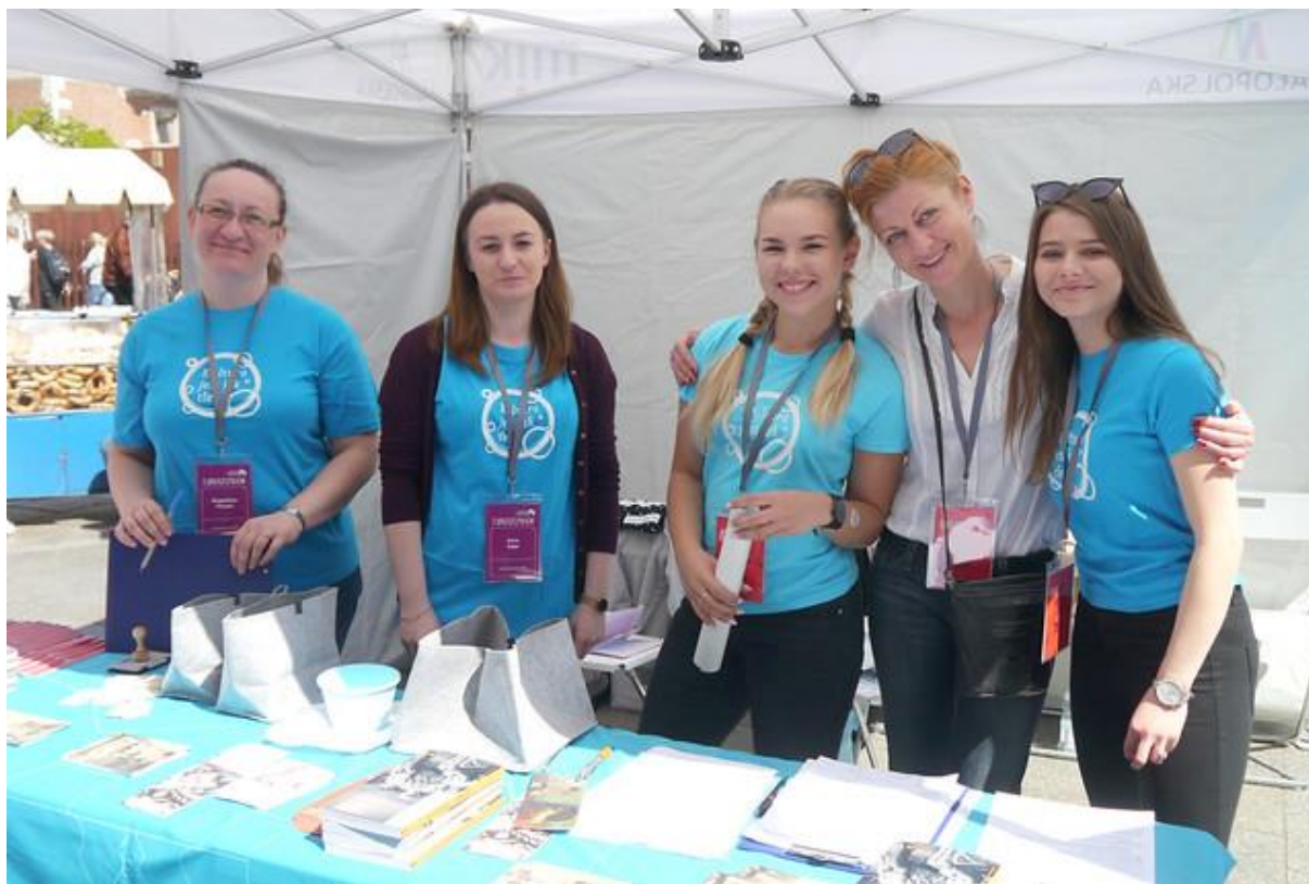
Wolontariusze w punkcie informacyjnym przy pałacu Potockich w Krakowie

Liczba wolontariuszy w poszczególnych obiektach była dostosowana do liczby wydarzeń przewidzianych w programie (oprowadzania z przewodnikami, spacer, warsztaty, wystawy). Najliczniejsze ekipy wolontariuszy pracowały w obiektach krakowskich (6–8 osób), w dwóch obiektach na trasie małopolskiej było po dwóch wolontariuszy, w pozostałych miejscach 4–5 osób. W każdym punkcie informacyjnym obecny był pracownik MIK, który koordynował pracę wolontariuszy.