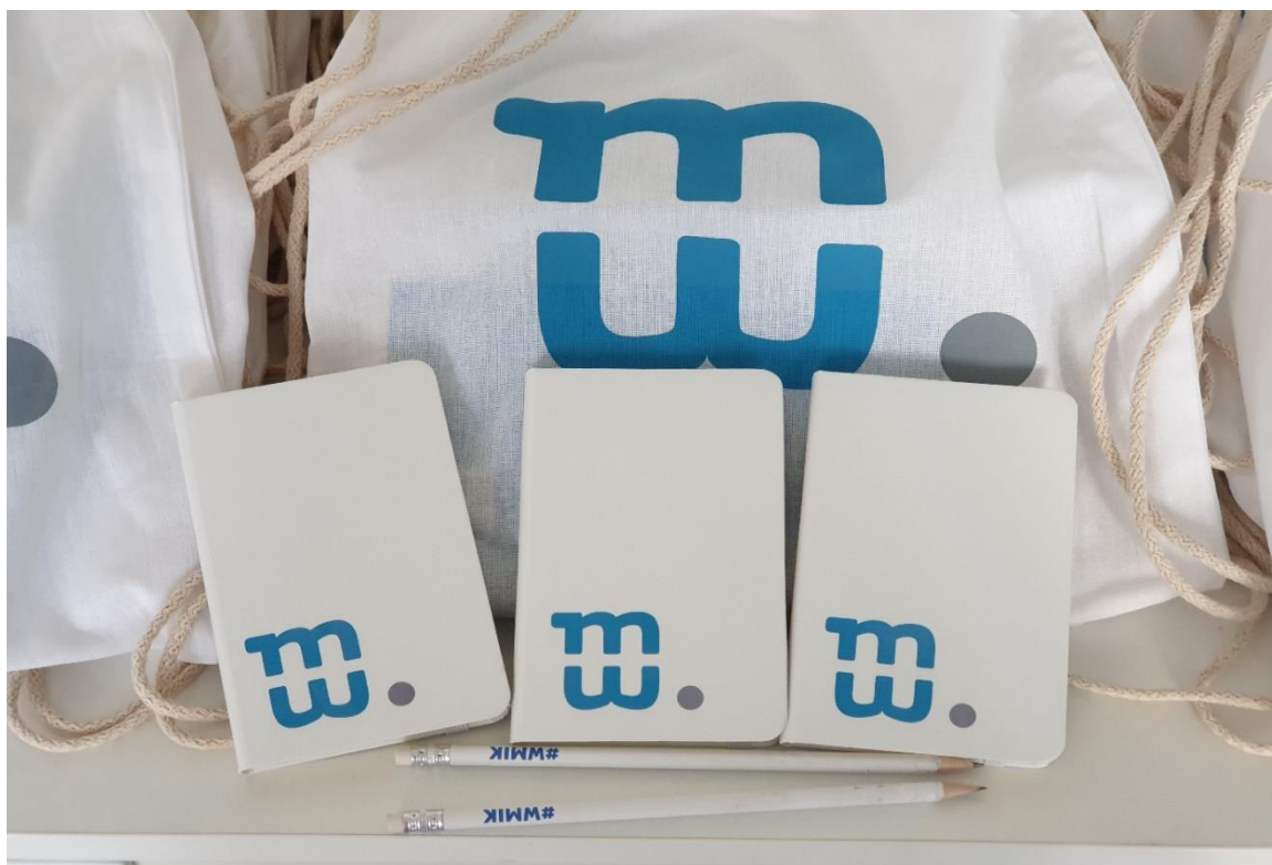
Notesy, ołówki i plecaki z logo wolontariatu, fot. M. Chlanda, MIK 2019 ©

Na spotkaniu ewaluacyjnym zorganizowanym dla wolontariuszy w czerwcu w siedzibie MIK-u, zostały rozdane zaświadczenia o wolontariacie oraz drobne upominki jako wyraz wdzięczności za zaangażowanie i poświęcony czas.